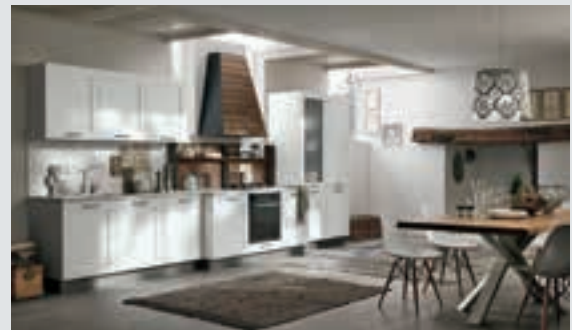
4 composition page 28