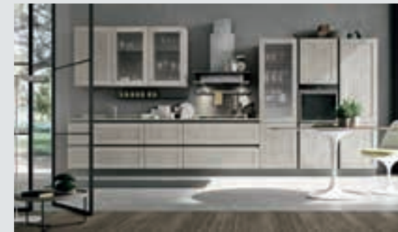
3 composition page 24