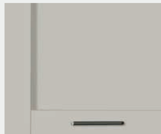
Pet cachemere opaco