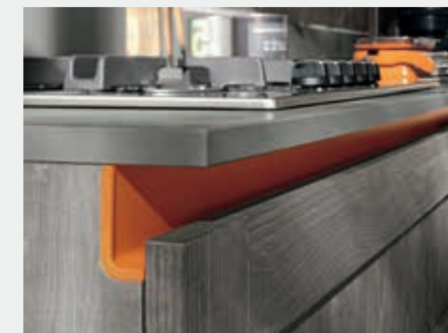
GOLA SCAVATA disponibile in 10 colori. HOLLOW GROOVE available in 10 colors.