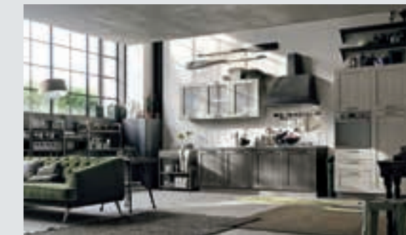
9 composition page 58