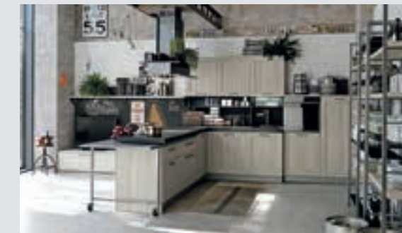
8 composition page 48