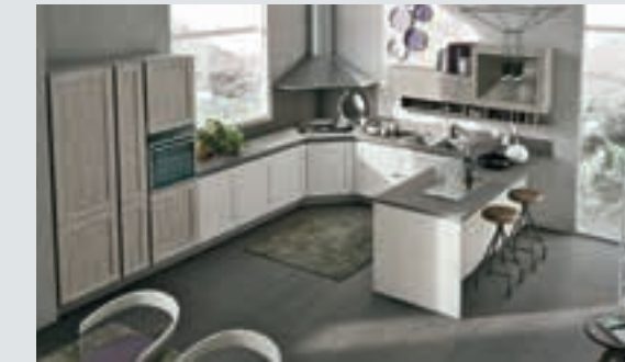
12 composition page 78