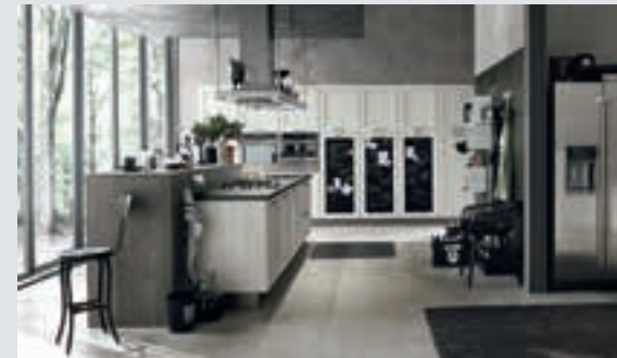
2 composition page 18