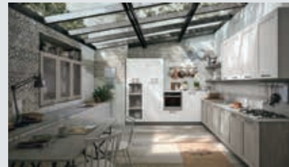
5 composition page 36