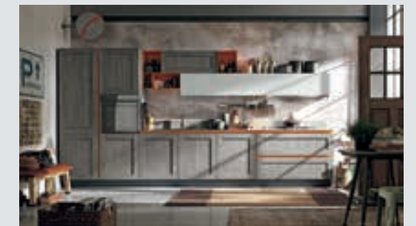
10 composition page 66