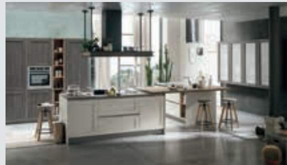
1 composition page 6