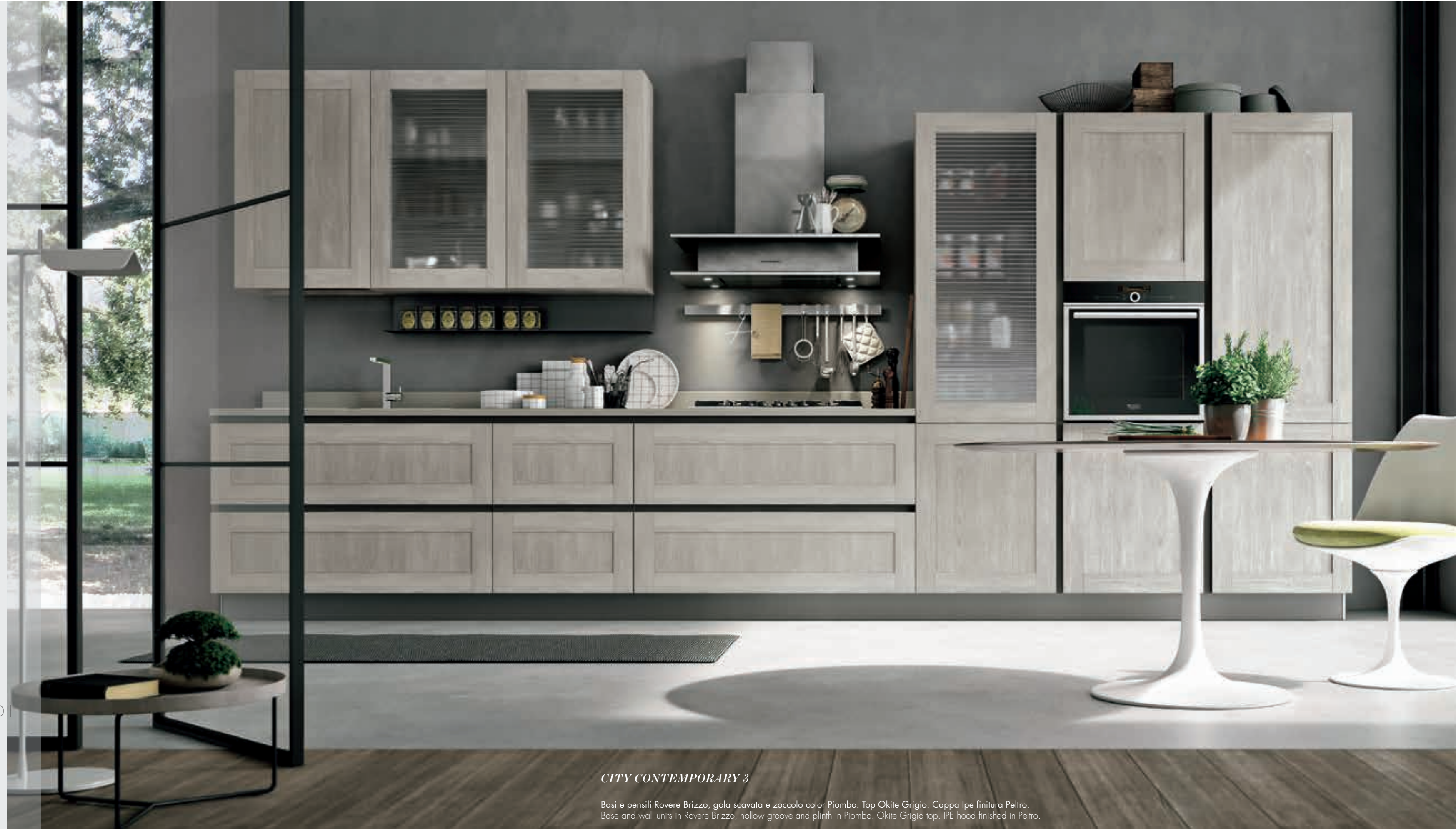
CITY CONTEMPORARY 3

THE LINEAR VERSION OF CITY IS EASILY RECONISABLE. ITS CHARM IS MAINTAINED IN THE PLAY ON VOLUME CREATED BY THE IPE HOOD AND ONDULINA GLASS DOORS WITH THEIR UNIQUE SATIN EFFECT.