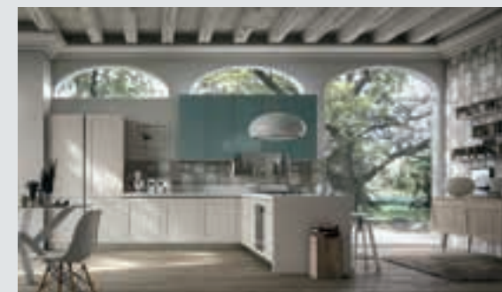
6 composition page 40