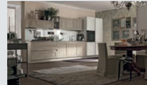
11 composition page 72