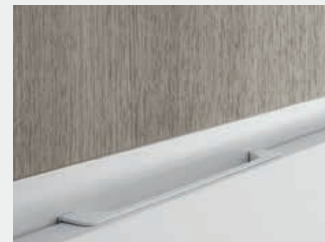
GOLA PIATTA CON TASCA disponibile in 5 colori. FLAT GROOVE WITH POCKET Available in 5 colors.