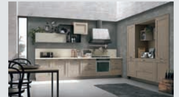
13 composition page 82