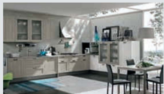
7 composition page 42